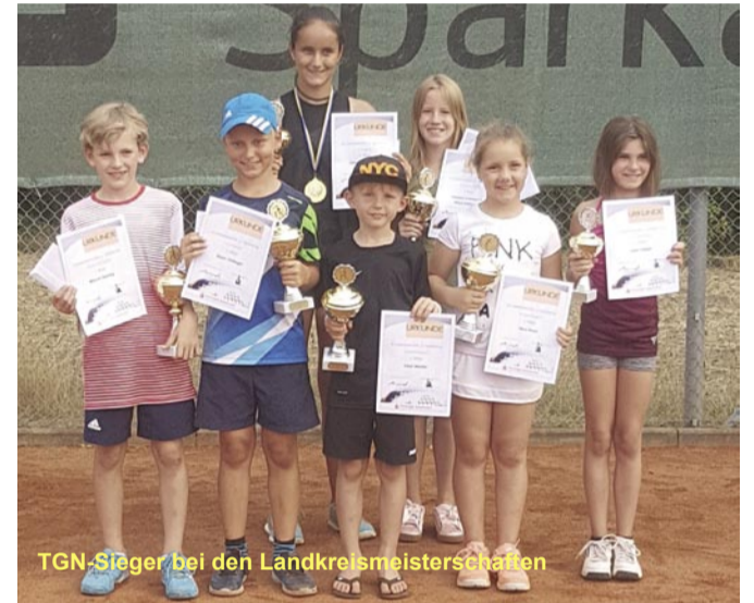
TGN-Sieger bei den Landkreismeisterschaften