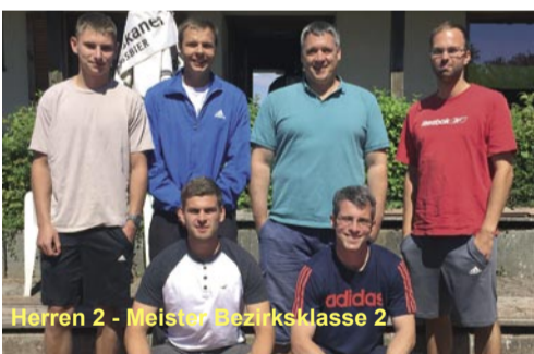
Herren 2 - Meister Bezirksklasse 2