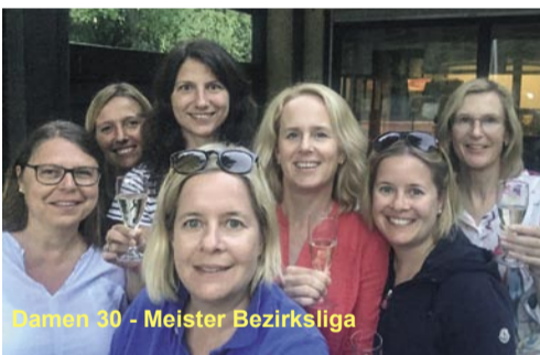
Damen 30 - Meister Bezirksliga