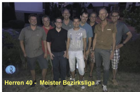
Herren 40 - Meister Bezirksliga