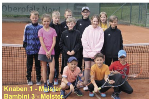
Knaben 1 - Meister Bambini 3 - Meister