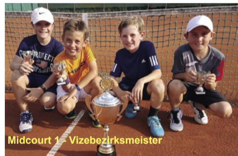
Midcourt 1 - Vizebezirksmeister