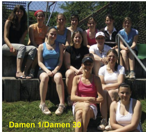
Damen 1/Damen 30