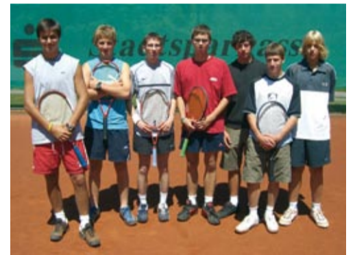
Herren 3 - Meister Kreisklasse 2