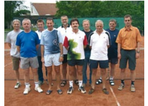
1. Herren 40 - Meister Bezirksklasse 1