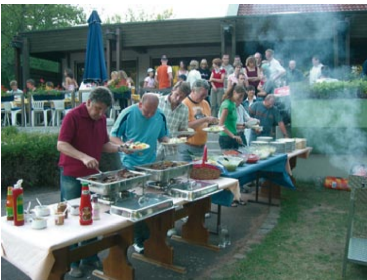
Grillfest mit Meisterschaftsfeier