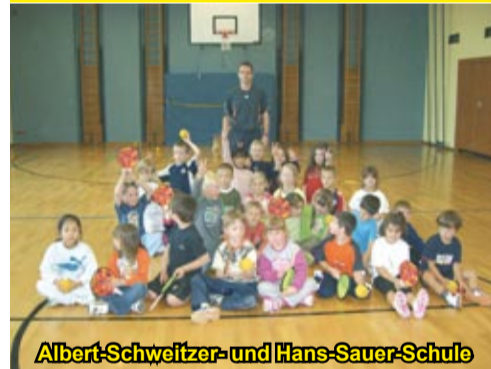
Albert-Schweitzer- und Hans-Sauer-Schule