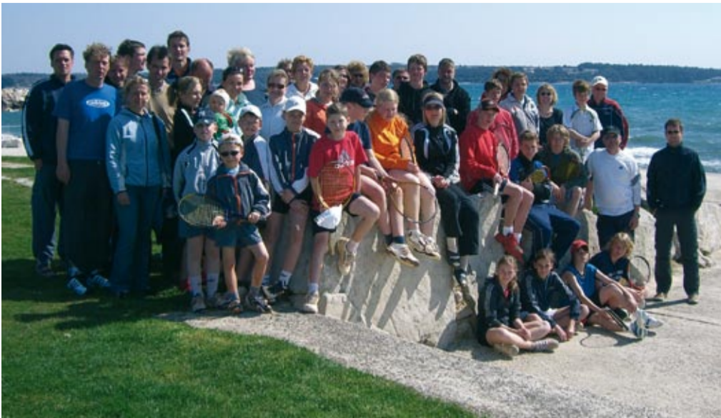
Tenniscamp in Kroatien in den Osterferien