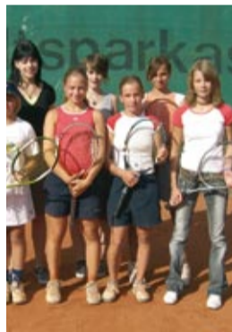
Juniorinnen 2 - Meister Kreisklasse 1