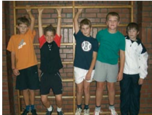
Bambini 1 - Bezirksmeister