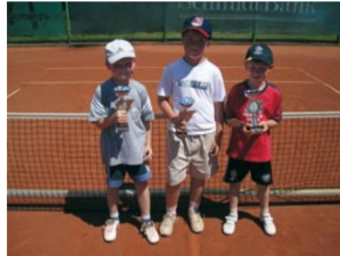
Kleinfeld U8 - Bezirksmeister