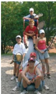
Bambini 2 - Meister Kreisklasse 1