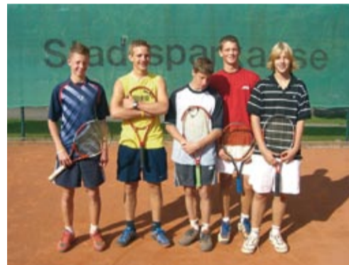
Junioren 2 - Meister Bezirksklasse 2