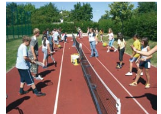
Tennis im Rahmen einer Projektwoche in der Rehbühlschule