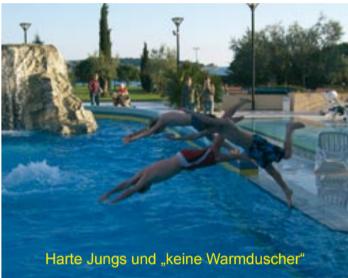
Harte Jungs und „keine Warmduscher“