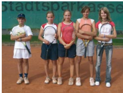
Mädchen - Meister Bezirksklasse 1