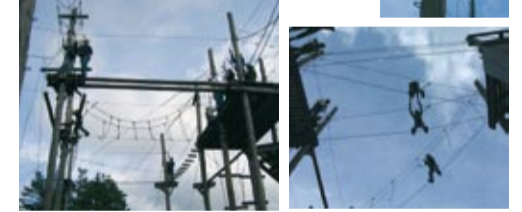
Die Mutigen im Hochseilgarten