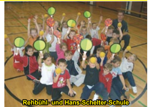
Rehbühl- und Hans-Schelter-Schule