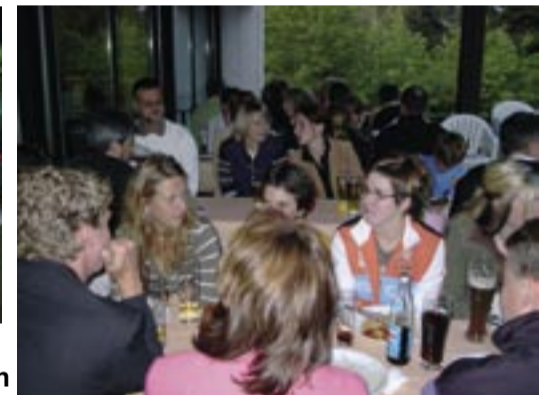
Meisterschaftsfeier - 7 Meister müssen ausgiebig gefeiert werden