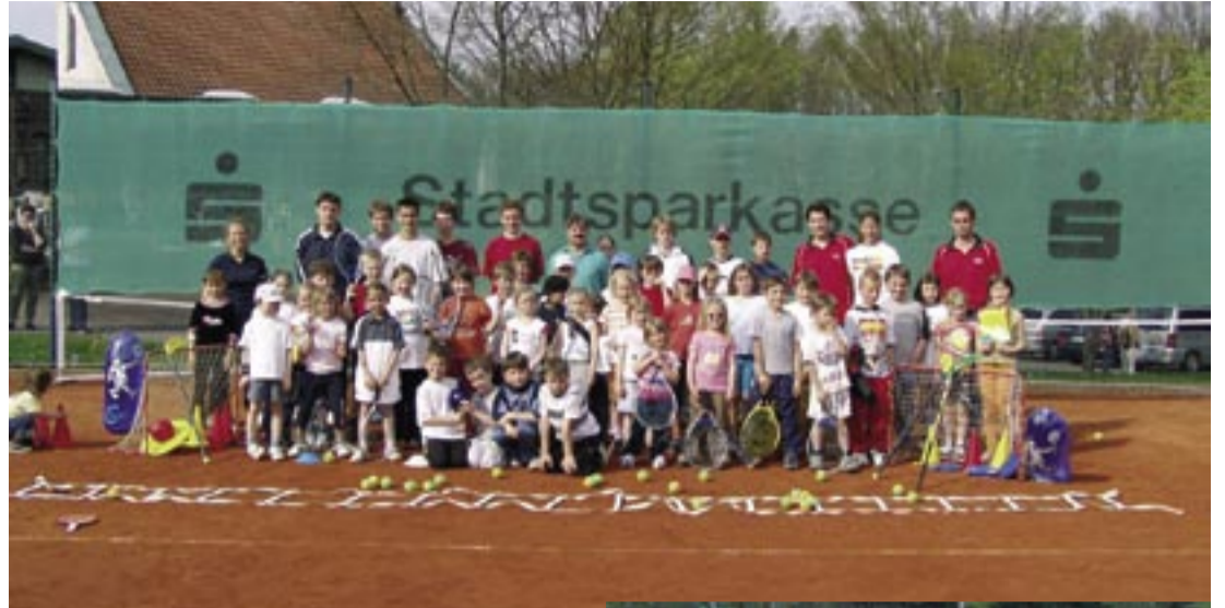
Tennis-Aktionstag mit Abschlussturnier der Tennis-SAGs