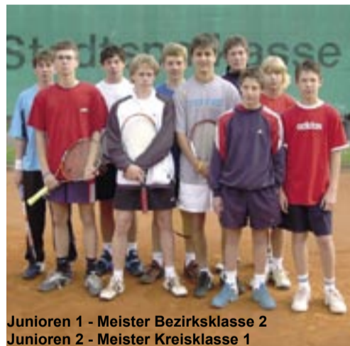
Junioren 1 - Meister Bezirksklasse 2 Junioren 2 - Meister Kreisklasse 1