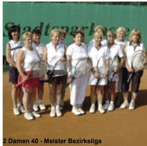
2. Damen 40 - Meister Bezirksliga