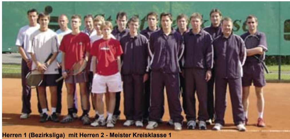
Herren 1 (Bezirksliga) mit Herren 2 - Meister Kreisklasse 1