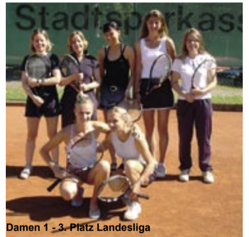
Damen 1 - 3. Platz Landesliga