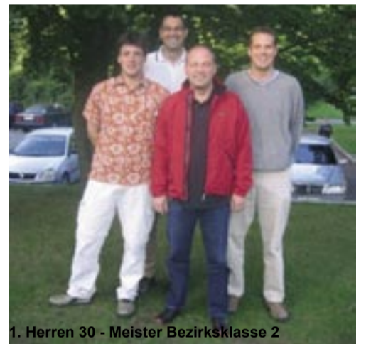
1. Herren 30 - Meister Bezirksklasse 2