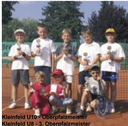
Kleinfeld U10 - Oberpfalzmeister Kleinfeld U8 - 3. Oberpfalzmeister